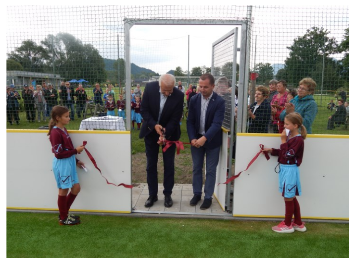
Prestrihnutie pásky na viacúčelovom ihrisku